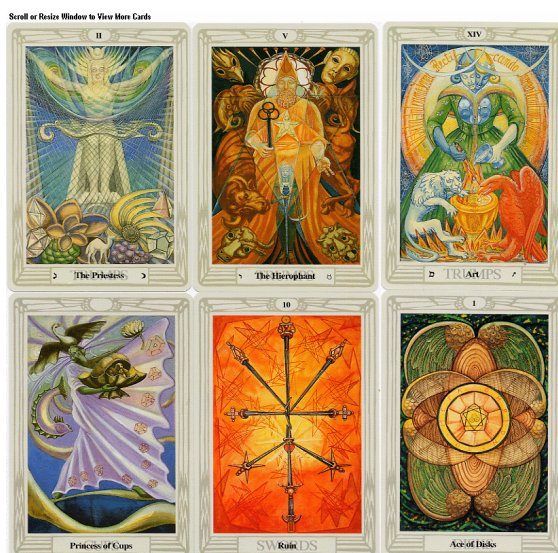
Aleister Crowley Thoth Tarot kaarten

Aleister Crowley's aanvankelijk opzet was om in een project van ongeveer zes maanden de symboliek van de tarot, zoals bijvoorbeeld weergegeven in het Rider Waite spel, te updaten. Het project groeide echter steeds maar uit en bestreek uiteindelijk wel vijf jaar. Van 1938 tot 1943 werkten hij en de kunstenares Frieda Harris aan de nieuwe tarot. Geen van beiden leefde echter lang genoeg om hun tarot gedrukt en gepubliceerd te zien. Een volgeling van Crowley nam in 1969 de taak op zich voor de publicatie, maar het resultaat was ondermaats. Pas in 1977 werden de originele schilderijen van Harris opnieuw gefotografeerd voor een tweede uitgave. De huidige editie is gebaseerd op een nieuwe update die plaatsvond in 1986.