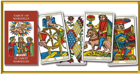
In 1930 uitgegeven door Paul Marteau

Niet elk spel dat onder de naam Tarot de Marseille door het leven gaat, komt ook van deze Zuid-Franse havenstad. Marseille mag dan gedurende een periode een drukke speelkaartenindustrie gehad hebben, ook in Lyon en Parijs werden veel tarots gemaakt. Tarot de Marseille is dan ook eerder de benaming (in de vakliteratuur vaak afgekort tot TdM) van een familie kaarten met een kenmerkende tekenstijl dan een verwijzing naar de stad van herkomst.