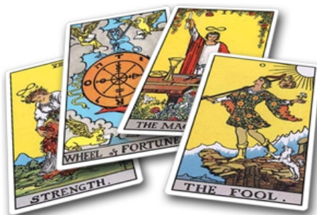
Rider Waite tarot kaarten

De 56 kleine Arcana kaarten zijn 56 'kleine geheimen'.